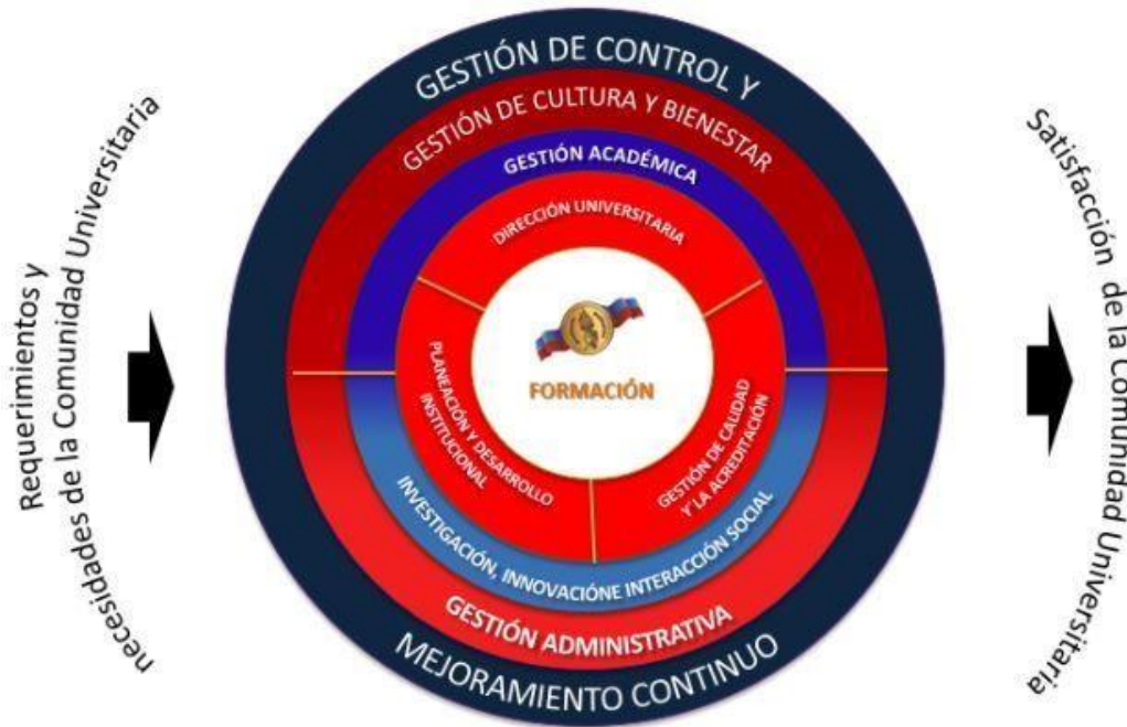
Figura 1. Mapa de procesos de la Universidad del Cauca