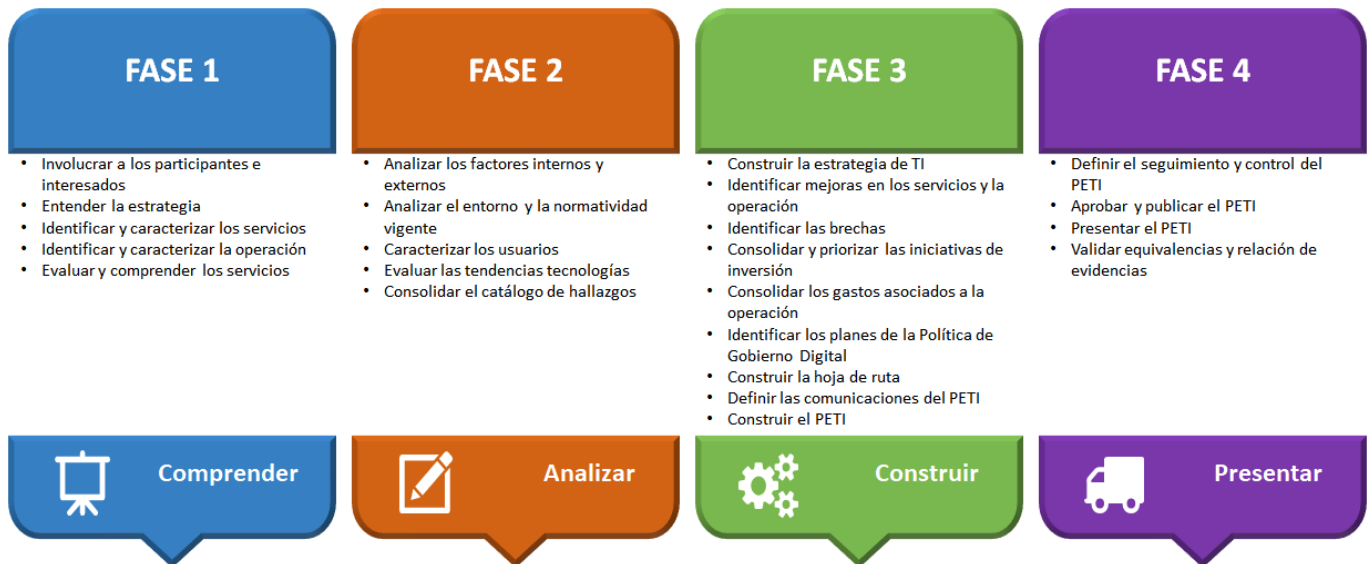
Figura 1. Fases de la metodología para el desarrollo del Plan Estratégico de Tecnologías de la Información (PETI)

La metodología que se debe usar para desarrollo del proyecto se fundamenta sobre el enfoque básico de la guía (G.ES.06 Guía para la construcción del Plan Estratégico de Tecnologías de la Información (PETI) - Planeación de la Tecnología para la Transformación Digital, establecida por el Ministerio de Tecnologías de la Información y las Comunicaciones (MinTIC), el proponente deberá cumplir las fases y actividades definidas con la posibilidad de adicionar las que considere necesarias para complementar el Plan Estratégico de Tecnologías de la Información (PETI) para la UNIVERSIDAD DEL CAUCA. La figura 1 ilustra lo enunciado: